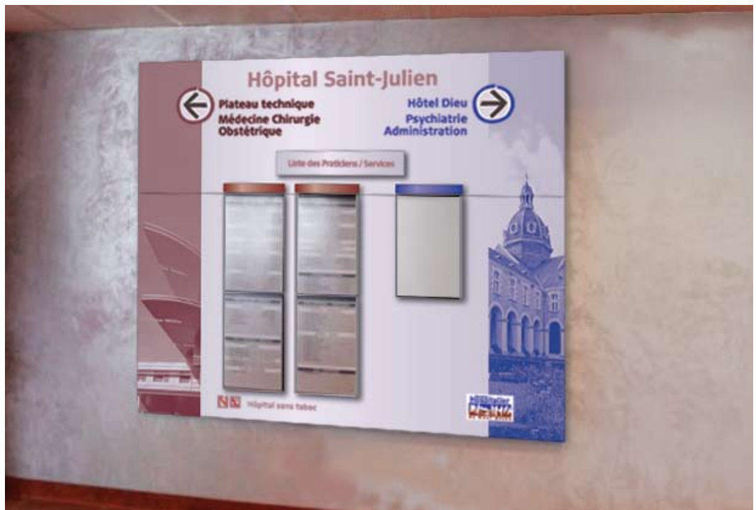
Répertoire des médecins →