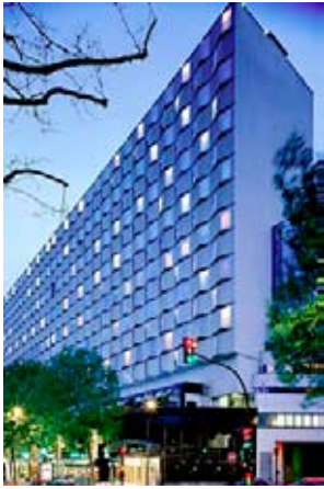
Paris Rive Gauche Conference Centre

Signalétique intérieure dynamique pour le plus grand centre de conférences de Paris qui comprend 50 salles modulaires et pose un problème aigu d'orientation et de réservation.