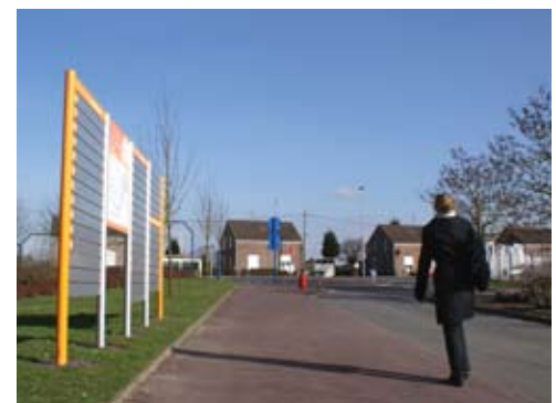
Un système d'adresses, numéros et noms de rues a été mis en place pour faciliter le balisage et le repérage des entreprises