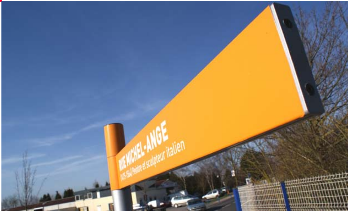
Panneau d'identification des rues en drapeau

Maître d'ouvrage : Communauté de Communes Coeur d'Ostrevent (3 zones d'activité)